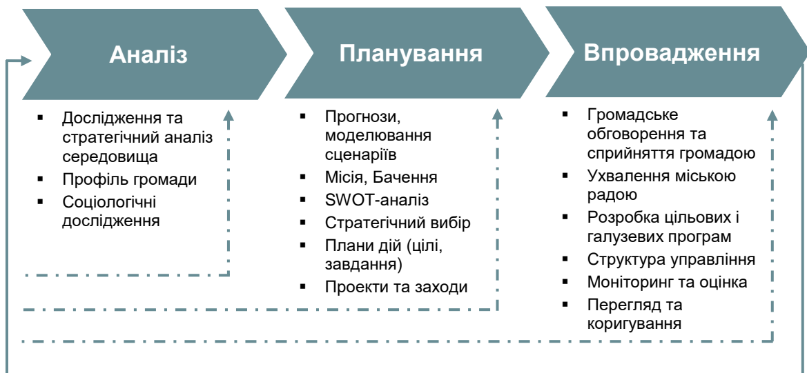
Рис. 1. Схема процесу розробки Стратегії

Під час розробки Стратегії розвитку міста Горішні Плавні (Стратегія) та Плану її реалізації використано методологію, яка складається з 6 логічних етапів : 1) Організація роботи зі стратегічного планування; 2) Аналіз середовища та факторів розвитку територіальної громади; 3) Визначення місії, бачення, сценаріїв та напрямів розвитку громади; 4) Розробка планів дій (Плану реалізації Стратегії); 5) Громадське обговорення та ухвалення Стратегії та Плану її реалізації; 6) Моніторинг та впровадження Стратегії.