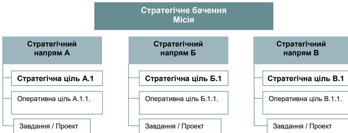
Рис. 2. Схема побудови Стратегії

Оперативні цілі показували, як необхідно проводити зміни та визначати стратегічні цілі кількісно, показували терміни виконання, конкретних виконавців, результат виконання, обсяги та джерела фінансування, конкретні заходи.